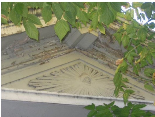
Foto 3-Cementerio de Chacarita