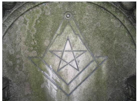
Foto 4-Cementerio Británico