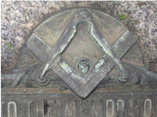
Foto 1-Cementerio Británico