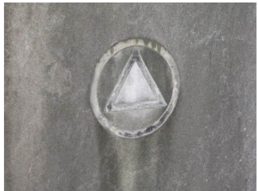
Foto 9-Cementerio Británico