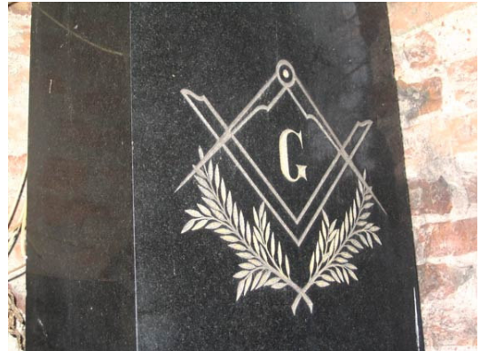
Foto 2-Cementerio Británico