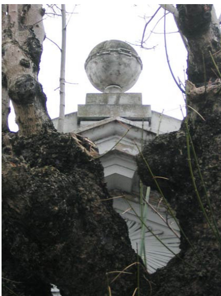
Foto 5-Cementerio de Chacarita